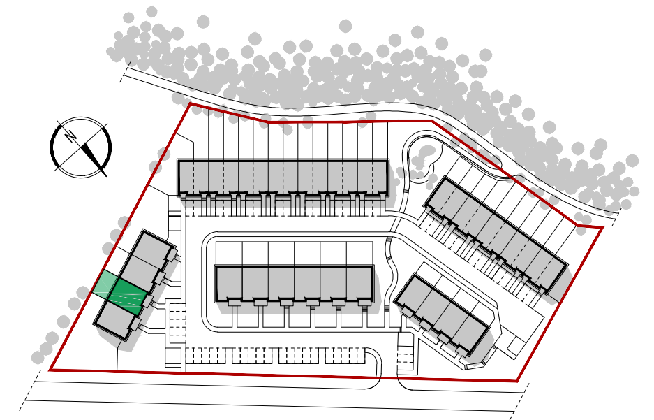
USYTUOWANIE MIESZKANIA NA RZUCIE OSIEDLA