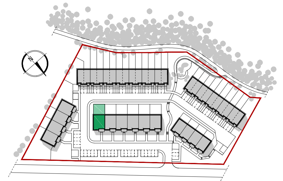
USYTUOWANIE MIESZKANIA NA RZUCIE OSIEDLA